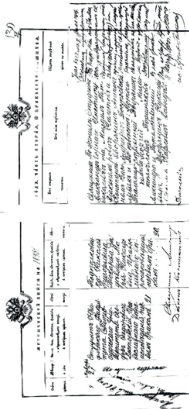
Илл. 5. Запись о первом браке и о разводе Ф. Ф. Достоевского (ЦГИА СПб. Ф. 19. Оп. 127. Д. 268. Л. 129 об. – 130) Fig. 5. The Record of the first marriage and divorce of F.F. Dostoevsky (Central State Historical Archive of St. Petersburg. Fund 19. Inventory 127. Case 268. Leaves 129 (verso) – 130