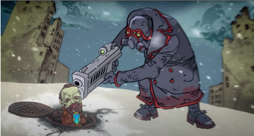
Илл. 3. Кадр из видеоклипа «Идиот». Киборг-убийца целится в Достоевского Fig. 3. Scene from the video The Idiot . Cyborg assassin aiming at Dostoevsky

Приземлившись в некоем дворце-музее, они сходят вниз по мраморной лестнице мимо витрин с застывшими фигурами и спускаются в подвальное помещение. Девушка подводит Достоевского