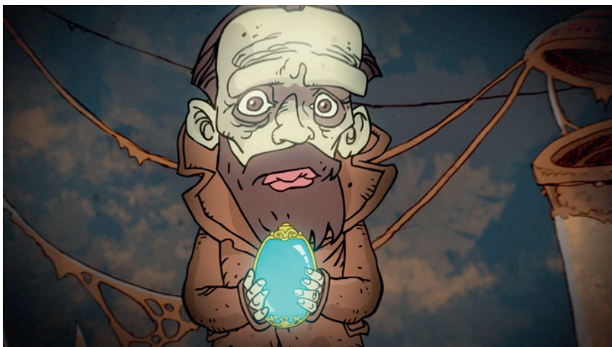
Илл. 5. Кадр из видеоклипа «Идиот». Достоевский и пасхальное яйцо.

В четырехминутном ролике решается драматическая судьба писателя в современном мире, который отторгает его, преследует его, стремится любыми средствами уничтожить, отменить, стереть с лица земли. Санкт-Петербург оказывается для петербургского писателя враждебной территорией, захваченной роботами и киборгами. Проект героической Мармеладки по возрождению и спасению наследия Пушкина и Чехова не успевает завершиться, и она гибнет