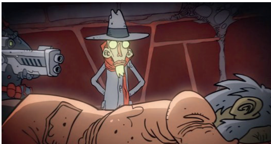
Илл. 4. Кадр из видеоклипа «Идиот».

Здесь мы сталкиваемся с известным феноменом, когда в художественном пространстве произведения (романа, сценария