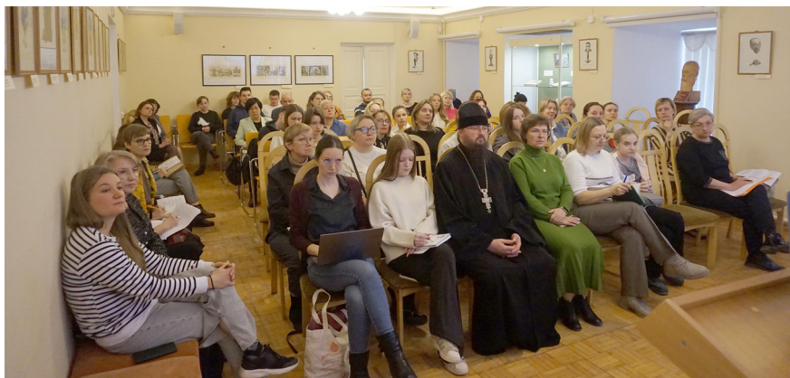
Илл. 2. Утреннее заседание первого дня чтений Fig. 2. First day, morning section