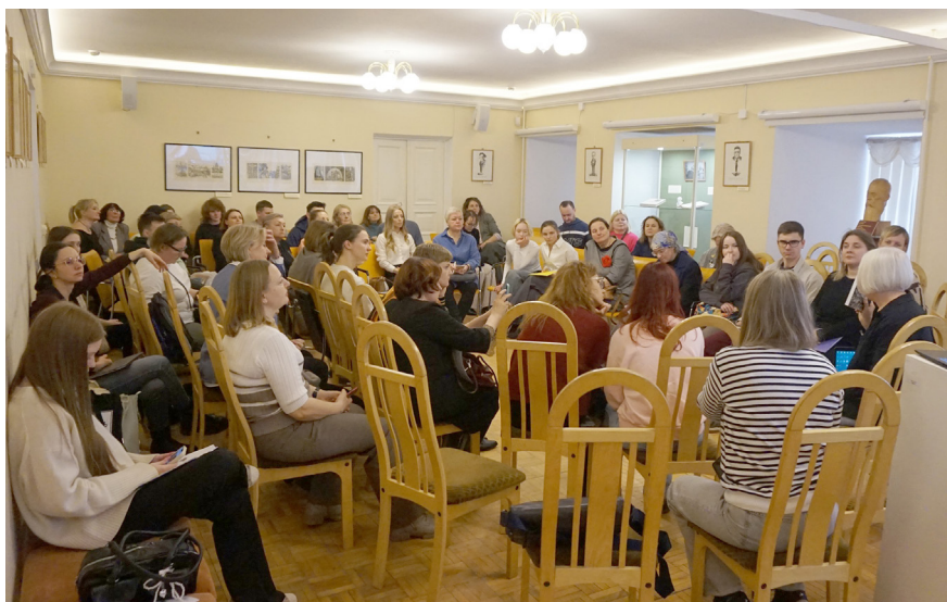
Илл. 11. Круглый стол Fig. 11. Round table