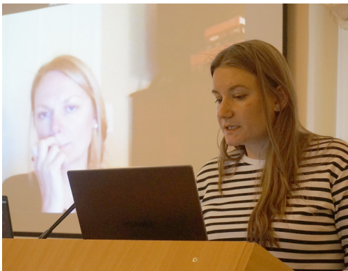
Илл. 7. Многолетний участник чтений, аспирант МГУ