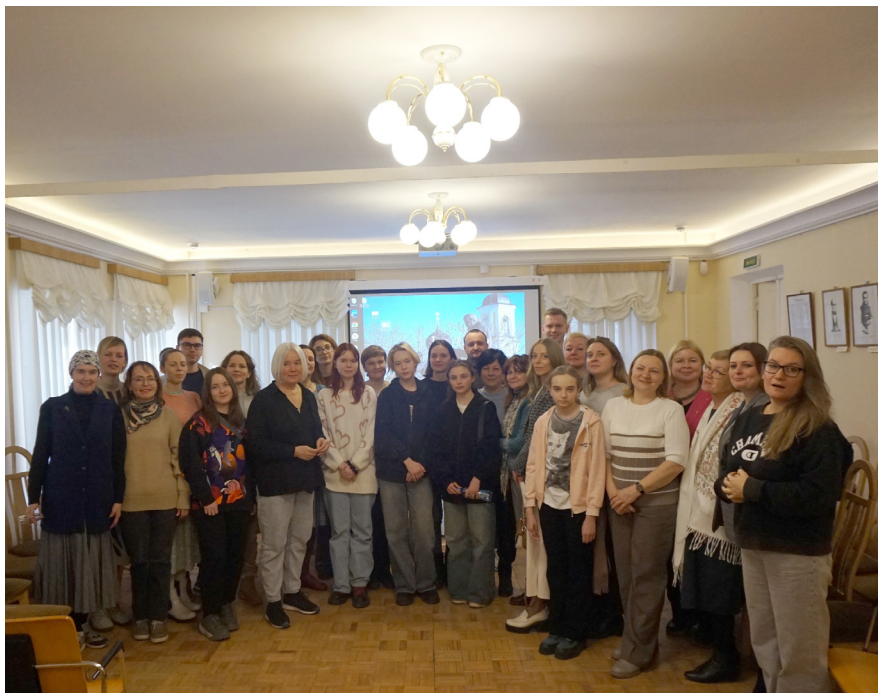
Илл. 12. Участники чтений (общее фото) Fig. 12. Participants of the Readings (group photograph)

Статья поступила в редакцию: 20.04.2025 Одобрена после рецензирования: 12.05.2025 Дата публикации: 25.06.2025