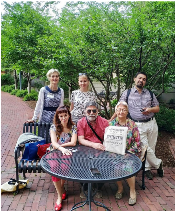
В Бостоне на XVII Симпозиуме IDS. 2019 г.

In Boston at the 27th Symposium of the International Dostoevsky Society, 2019