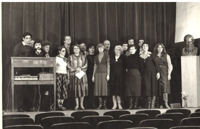
VIII чтения в Петербургском музее в 1983 г.

7th Readings at the Petersburg Museum in 1983